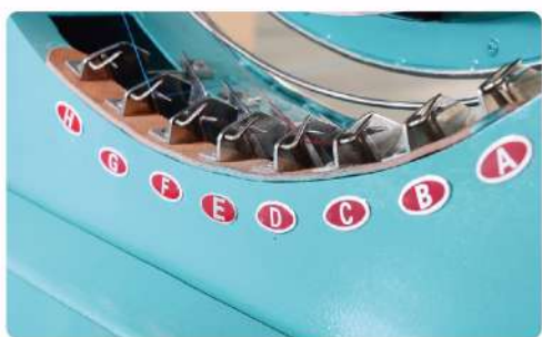
换纱机构 Change Yarn Device